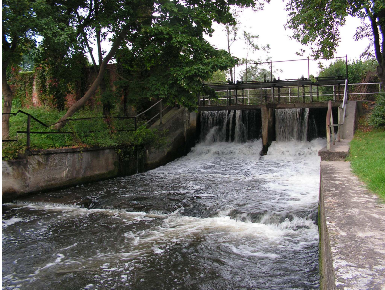
Fot. 1. Jaz młyński w Lęborku na rzece Lebie. Photo 1. Weir in Lębork on the Leba River.