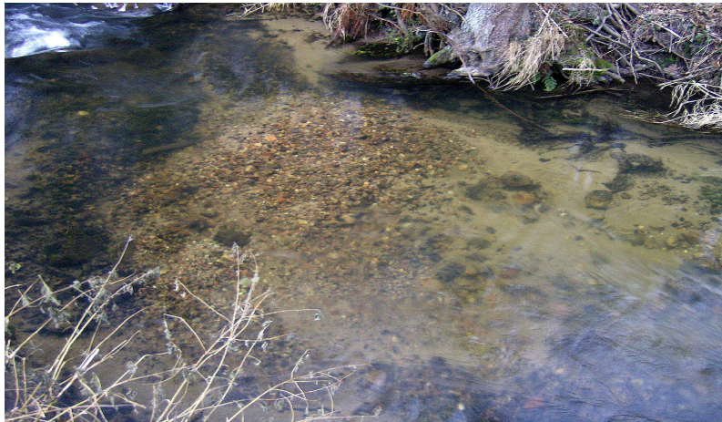
Fot. 2. Gniazdo tarłowe troci wędrownej w rzece Okalicy. Photo 2. Sea trout redd in the Okalica Stream.